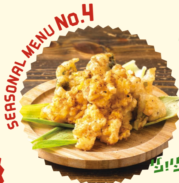
SEASONAL MENU No.4