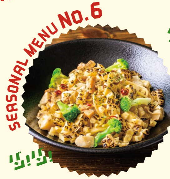
SEASONAL MENU No.6