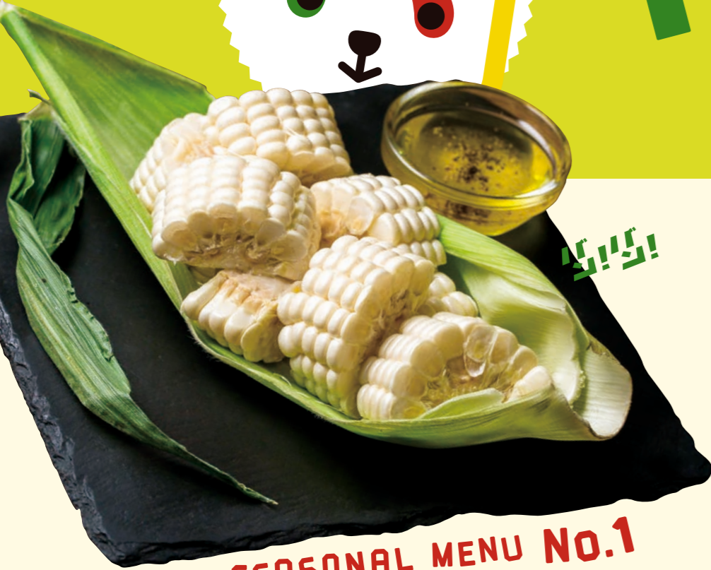
SEASONAL MENU No.1