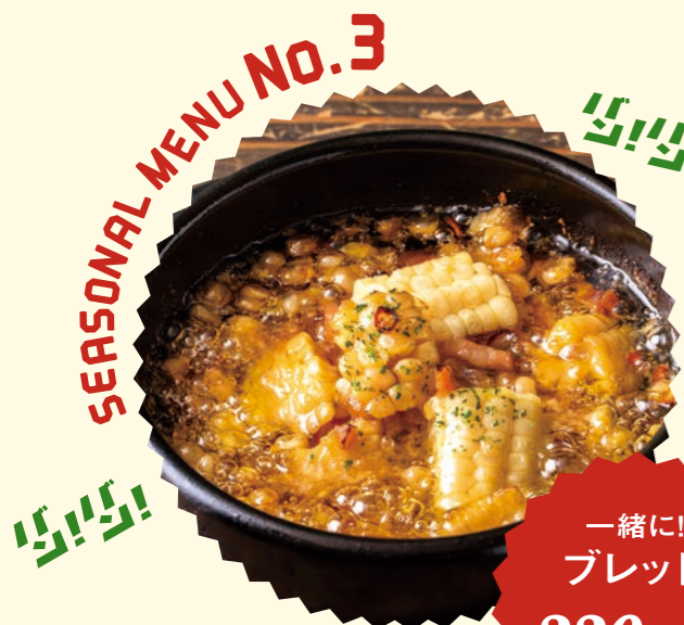
SEASONAL MENU No.3