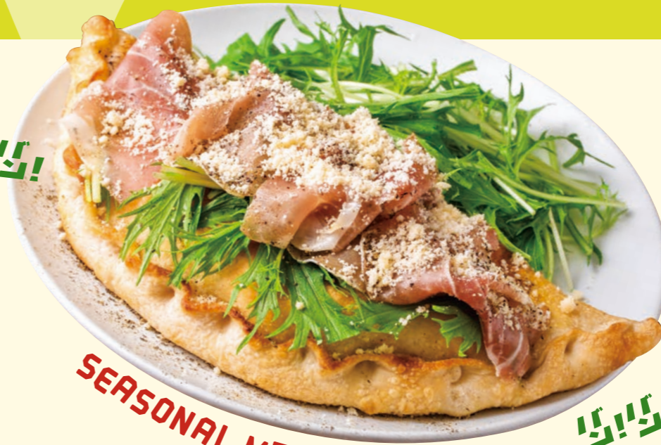
SEASONAL MENU No.2