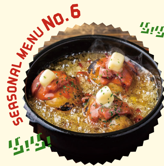
SEASONAL MENU NO.6