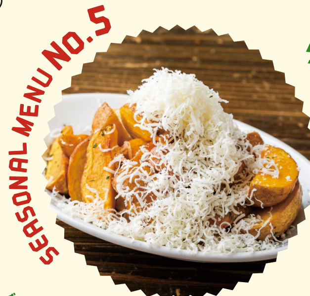
SEASONAL MENU NO.5