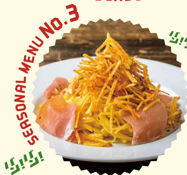
SEASONAL MENU NO.3