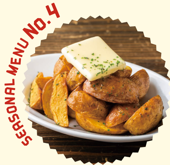
SEASONAL MENU NO.4